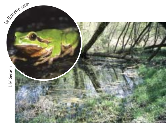
La Rainette verte

Le long du sentier, vous remarquerez la présence de trous d'eau, certains témoignant d'anciennes zones d'extraction de sable, d'autres d'origine naturelle. Ces milieux, devenus de riches zones humides, accueillent grenouilles, tritons et libellules pendant leur reproduction.