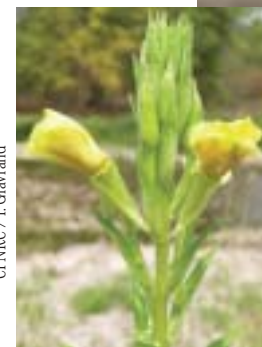
CPNRC / J. Gravrand